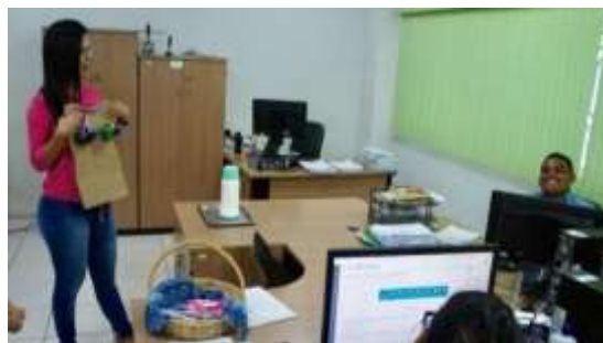
Foto 3. Orientação sobre câncer de mama aos homens do IFMA-Coelho Neto/Ma, Brasil.

Para evitar que o homem somente procure o serviço médico em casos de complicações, é importante pensar e executar uma abordagem de educação em saúde voltada para esta população, atentando-se para as especificidades de sua rotina e masculinidade.