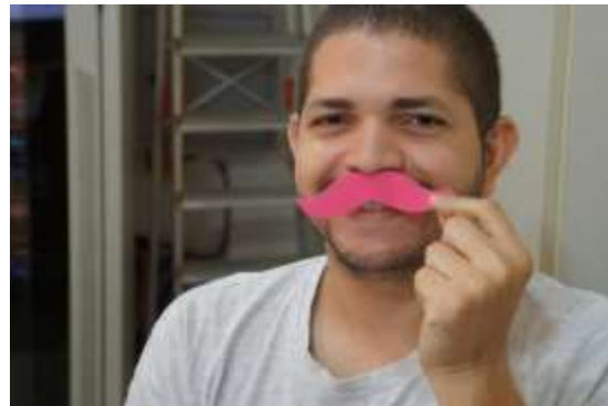
Foto 6. Participação dos homens na ação do IFMA-Coelho Neto/Ma, Brasil.