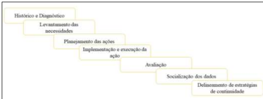
Figura 1. Processo teórico-prático da ação de enfermagem, “Nem todo outubro é rosa!”, Coelho Neto-Ma, Brasil.

Fonte: Autores. Adaptado de Backes et al. (2012).