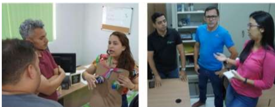
Foto 4. Orientação sobre câncer de mama aos homens do IFMA-Coelho Neto/Ma, Brasil.