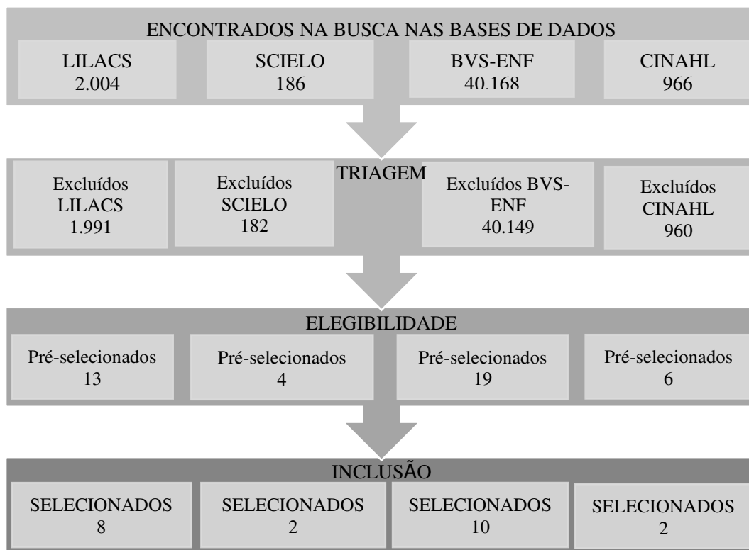
Figura 2 - Fluxograma de seleção dos artigos pela primeira busca nas bases de dados pesquisadas. Brasil, 2021.

Após a pré-seleção, os artigos foram lidos na íntegra e avaliados rigorosamente para compor a amostra final de onze artigos que foram apresentados na Tabela 1, com a identificação e título do artigo, ano e idiomas de publicação, objetivos, as bases de dados onde foram encontrados, periódico, tipo de estudo, local da pesquisa e nível de evidência científica que foi classificado pela proposta de Melnyk e Fineout-Overholt. Considerando que os estudos possuem caráter descritivo e/ou contemplam, cada estudo, apenas um local de pesquisa, adequam-se ao nível VI de evidência (Pompeo, Rossi & Galvão, 2009).