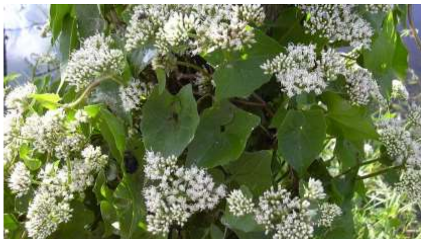
Figura 1. Imagem da espécie Mikania glomerata .