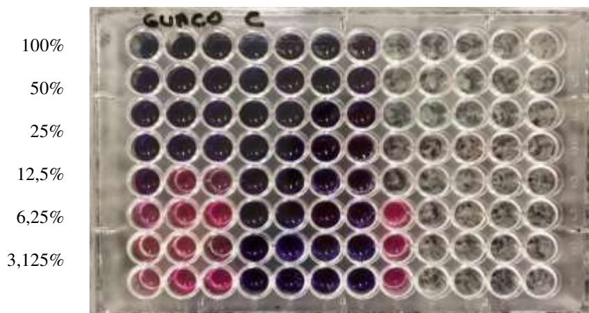
Figura 2. Microdiluição em placa de 96 poços para Staphylococcus aureus .

Para Staphylococcus aureus (ATCC 25923), o extrato apresentou atividade nas concentrações de 100% a 12,5% (Figura 2).