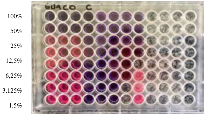
Figura 3. Microdiluição em placa de 96 poços para Escherichia coli .

Quando realizada a leitura para Escherichia coli (ATCC 25922) o extrato em estudo denotou atividade nas concentrações de 100% a 50 % (Figura 3).