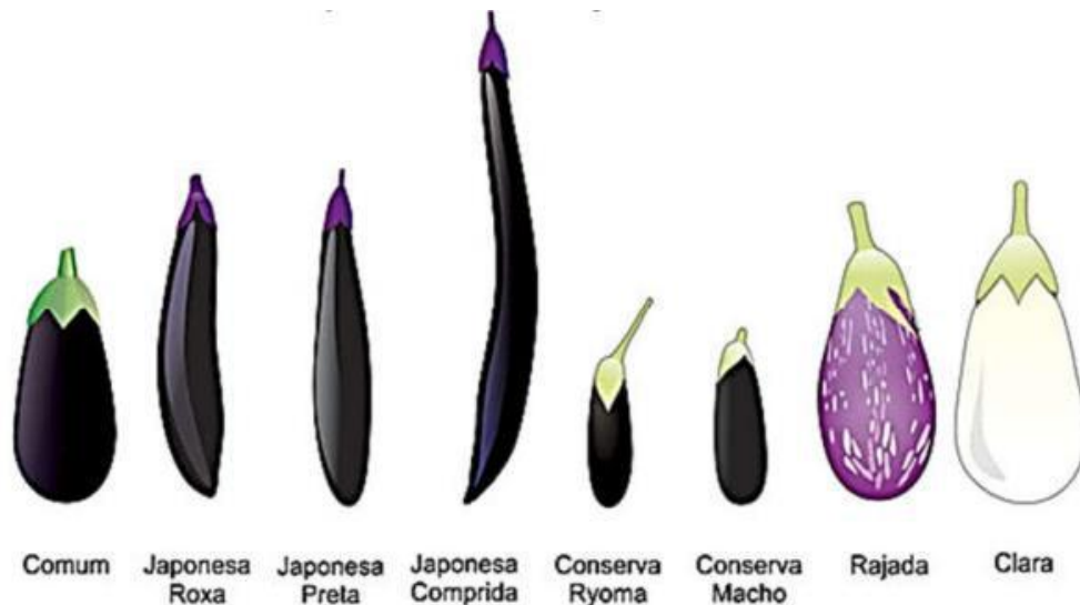
Figura 1. Classificação comercial da berinjela.