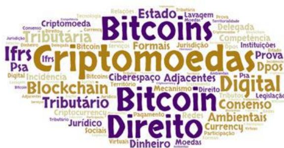
Figura 2 – Nuvem de palavras-chave.

Por fim, buscando identificar as palavras-chave propostas para os artigos analisados, trinta e quatro palavras-chave, entre termos simples e compostos. Quanto ao número de palavras-chave por artigo, um apresentou três palavras-chave, seis apresentou quatro palavras-chave, e um apresentou cinco palavras-chave, onde os periódicos limitam entre três e cinco palavras-chave. Foi desenvolvido uma nuvem de palavras, para ilustrar as palavras-chave, conforme ilustra a Figura 2, onde os termos mais utilizados como palavras-chave foram criptomoedas, bitcoin, bitcoins e direito.